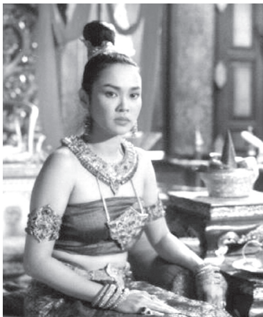
ท้าวศรีสุดาจันทร์ จากภาพยนตร์สุริโยไท